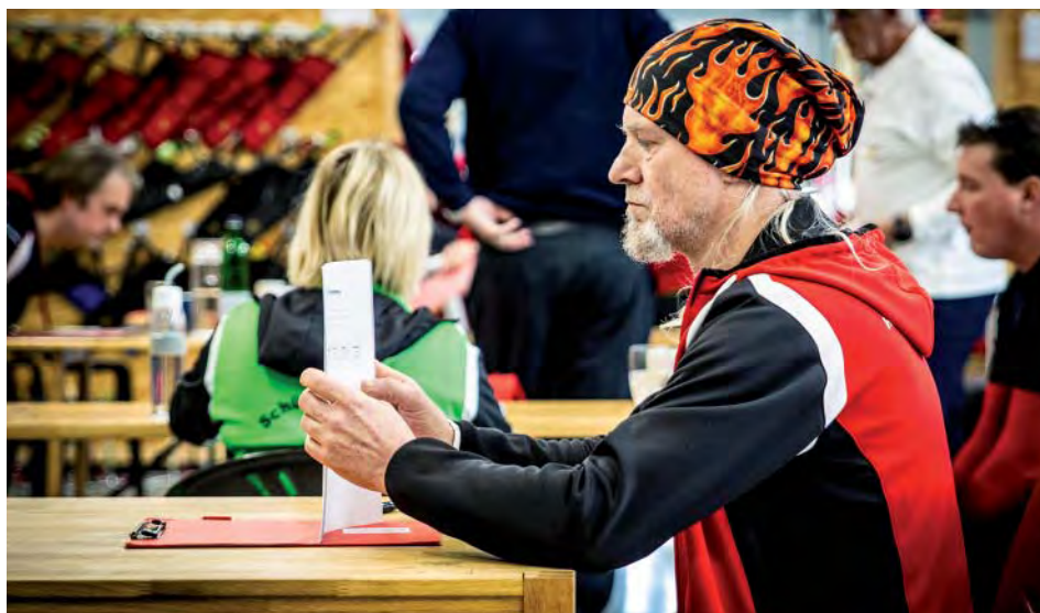
Nach dem theoretischen Teil folgt die schießtechnische Prüfung.

In den Vereinen, in denen kein gezieltes Training zur Ausbildung der Fähigkeiten von Bogenschützen praktiziert wird, stagnieren in der Regel irgendwann die Schießergebnisse. Markant am KFS-System ist, dass der Fokus nicht einzig und allein auf die Schießergebnisse gelenkt wird, sondern vielmehr auf die Ausbildung der speziellen Fähigkeiten der Bogenschützen, wie beispielsweise gleich zu Beginn auf den Erwerb der Technikgrundlagen. Die Motivation der Sportler wird bereits angefeuert, wenn sie im Rahmen der Prüfung ihre Punkte für den stabilen Stand, die richtige Körperspannung oder etwa eine sauber ausgeführte Expansion erhalten. Diese Motivationsstruktur ist ein fundamentaler Unterschied zu Bogenschützen im Lernprozess, die ihre Motivation bisher nur aus den Schießergebnissen