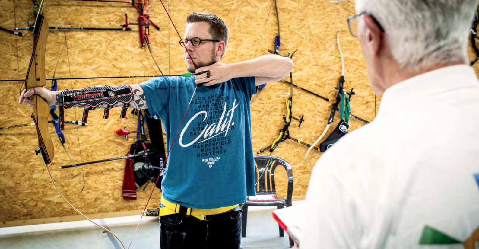
Schießtechnische Prüfung zum Orangegurt in Hamm.

ziehen und die Weiterentwicklung ihrer Fähigkeiten vernachlässigen. Stagniert dann die Leistung, kann die Motivationslage schnell kippen. Das KFS-System bietet gerade diesen Schützen ein Angebot für ihre sportliche Weiterentwicklung. Darüber hinaus werden Sportler ab dem Blaugurt motiviert, das Trainingssystem durch eine Instruktorentätigkeit im Verein zu beleben.