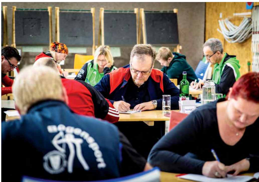
Theoretische Prüfung der Bogensportler in Hamm/Westfalen.

Das Kollegium zur Förderung der Schießtechnik (KFS) bietet Vereinen und deren Bogensportlern ein umfassendes Konzept mit praxisorientierten Anleitungen für ein strukturiertes Training und die systematische Ausbildung der Schießtechnik. Seit dem Aufbau dieses Ausbildungskonzepts im Jahre 2005 hat das KFS-Leitungsgremium die Inhalte stetig weiterentwickelt und verfügt heute über ein Ausbildungssystem, wie es bei anderen Sportarten seit vielen Jahren Standard ist. Ende Oktober besuchte das BOGENSPORT MAGAZIN das KFS in Hamm/Westfalen, um einen Einblick in dieses Trainingssystem zu bekommen.