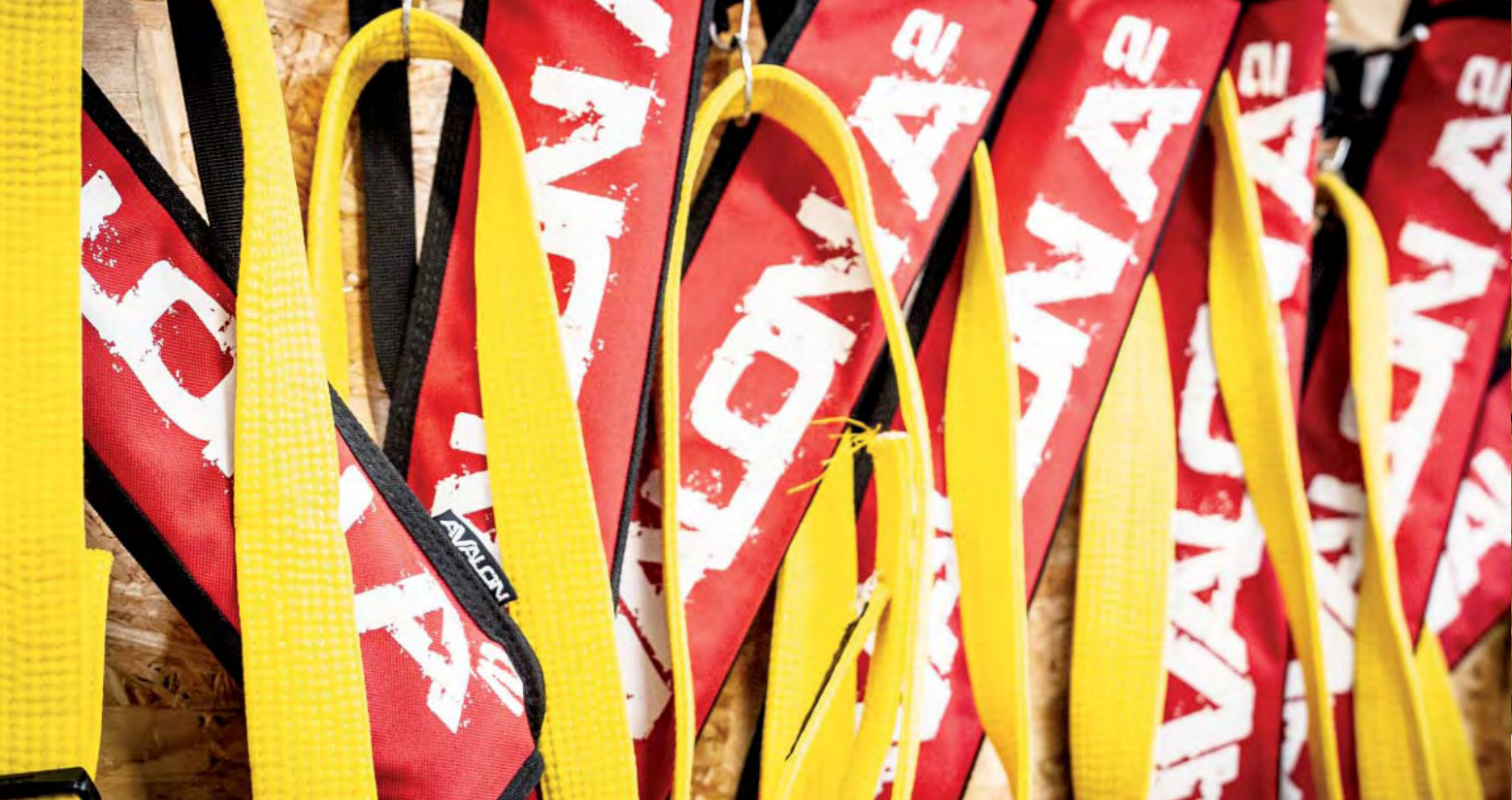
Begehrnt unter den KFS-Sportlern sind die farbigen Gurte für den Köcher, die besondere Motivationsschübe entfalten.

Die folgenden Inhalte bereiten die Sport-einsteiger auf die Orangegurtstufe vor: